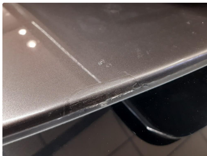
1.5 Steinsprut med rust