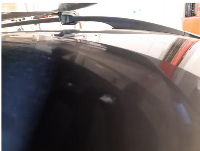
1.5 Steinsprut med rust