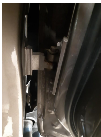
1.3 Hengsler defekt/slitt