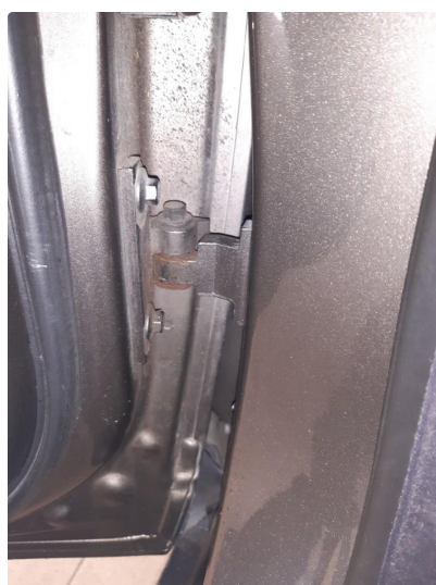
1.3 Hengsler defekt/slitt