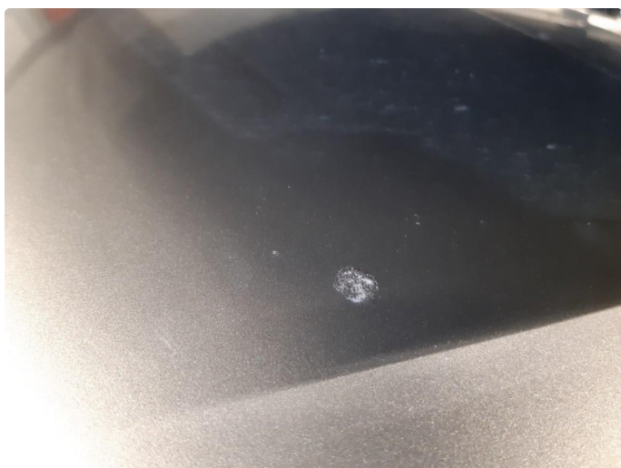
1.5 Steinsprut med rust