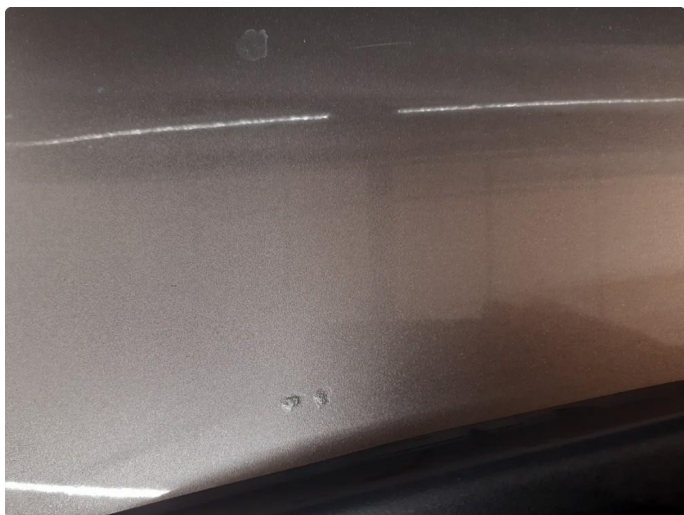
1.5 Steinsprut med rust