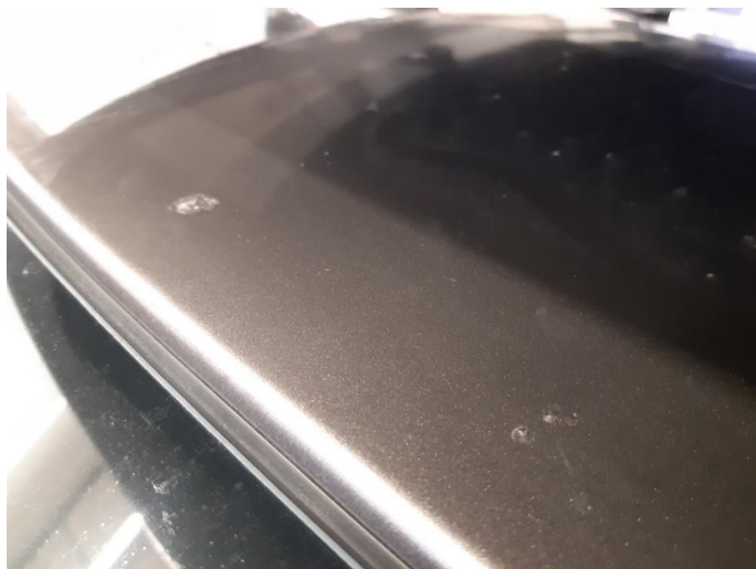
1.5 Steinsprut med rust