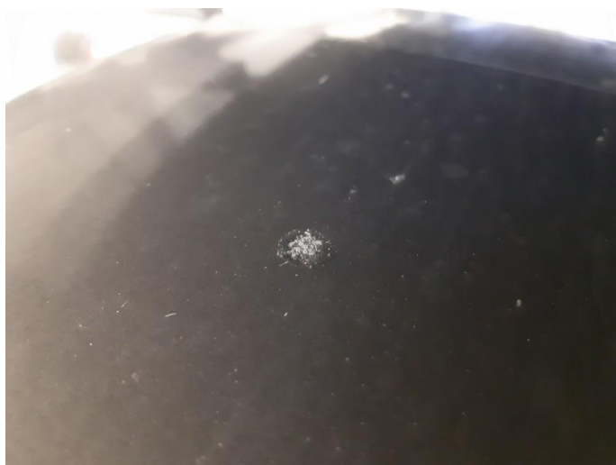
1.5 Steinsprut med rust