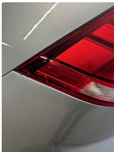
2.1 Krakelering i plast