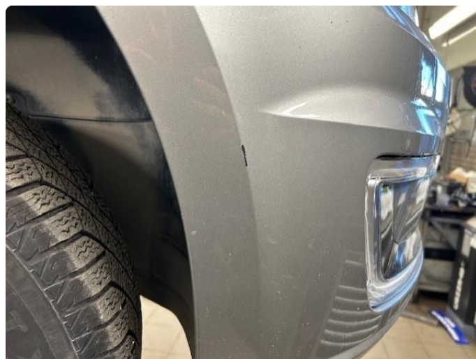
1.3 Ripe(r) ned til grunning