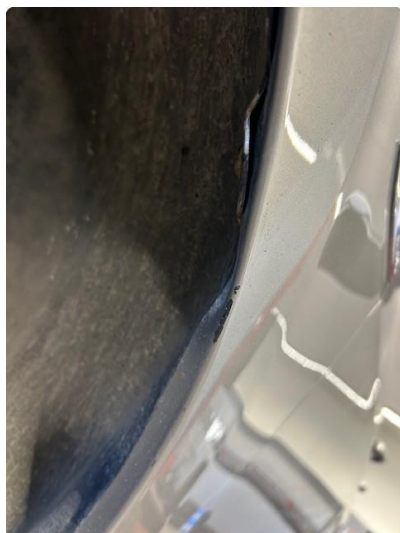
1.2 Lakk flasser