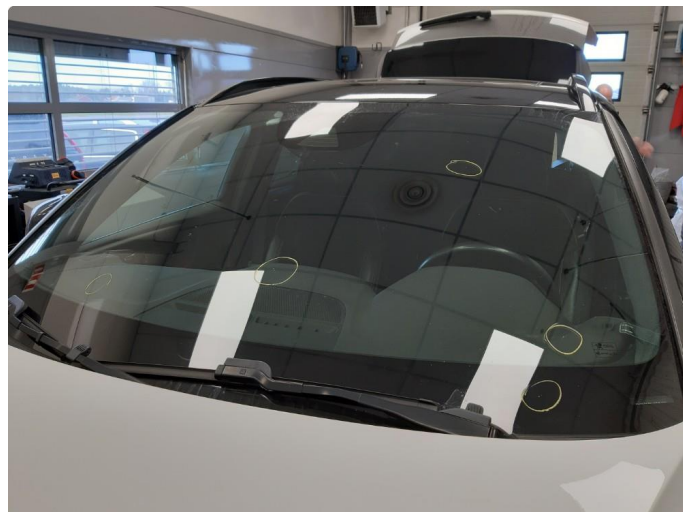
2.3 Steinsprut i synsfelt