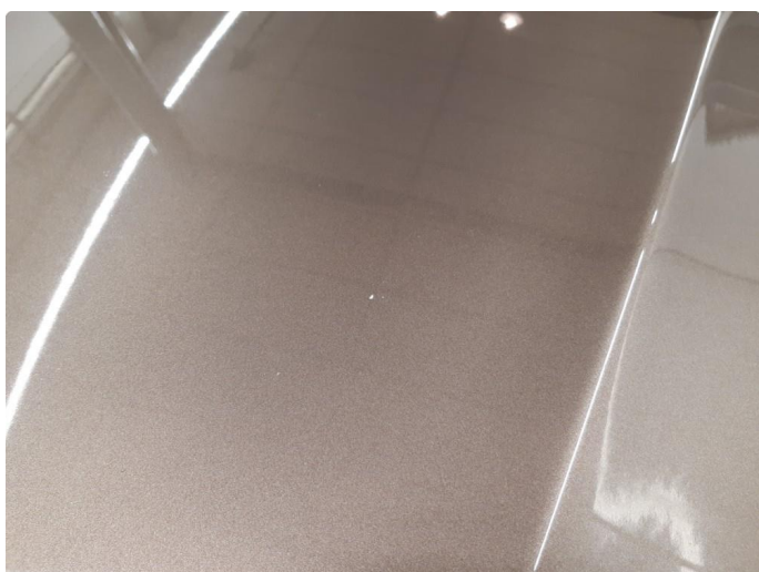
1.1 Noen bulker med lakkskader