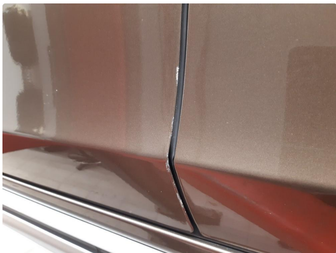
1.1 Noen bulker med lakkskader