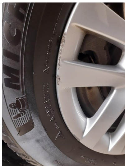
1.3 Kast i felg