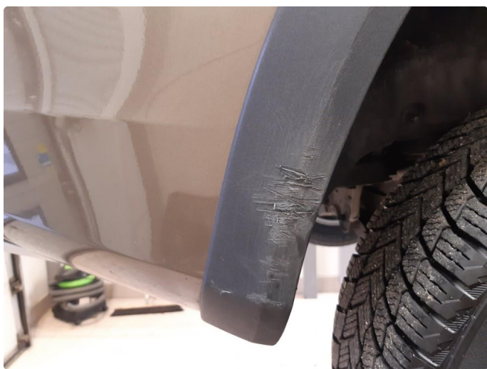
1.2 Skjermutbygger skadet