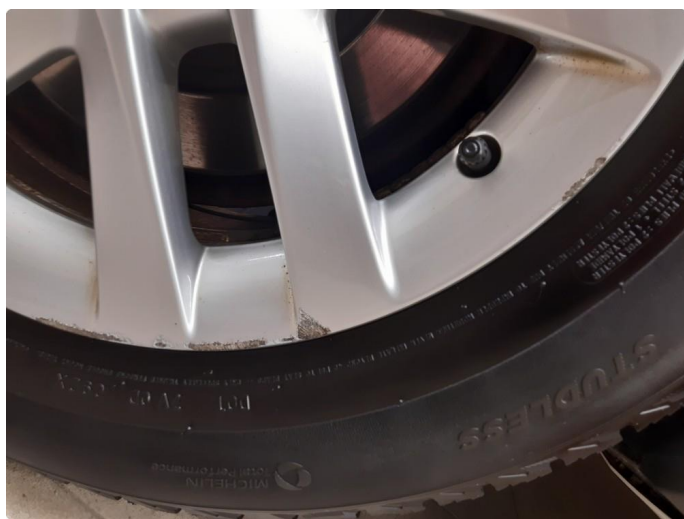
1.3 Kast i felg