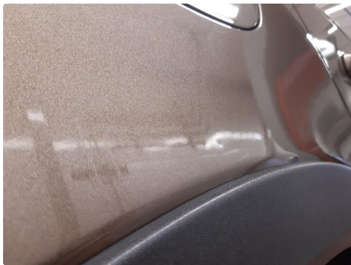
1.1 Noen bulker med lakkskader