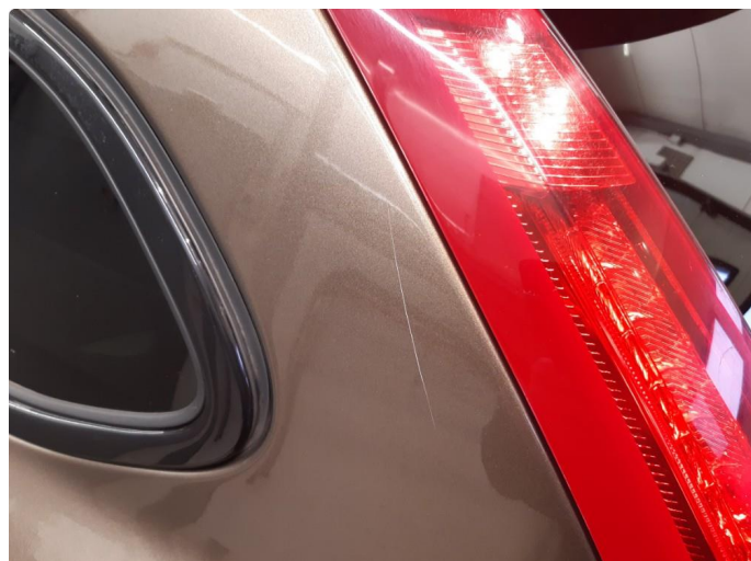
1.1 Noen bulker med lakkskader