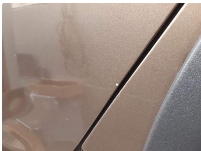
1.1 Noen bulker med lakkskader