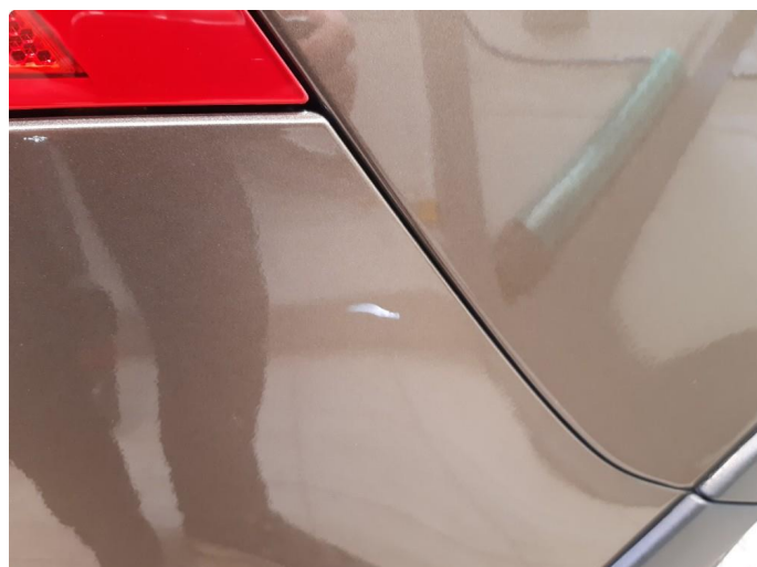
1.1 Noen bulker med lakkskader