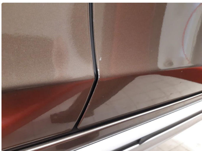
1.1 Noen bulker med lakkskader