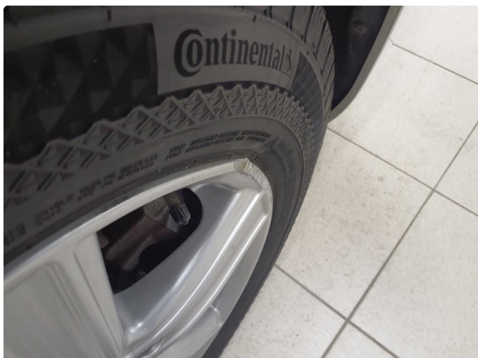
1.1 Skade på felg