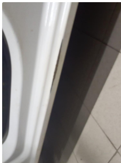
1.2 Noe slitt innsteg