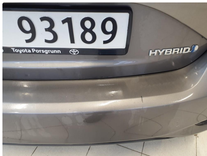
1.2 Noen bruksmerker