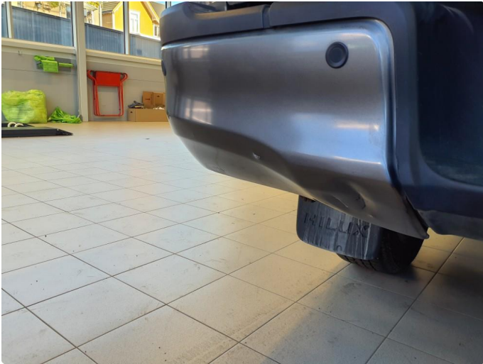
1.3 Liten bulk