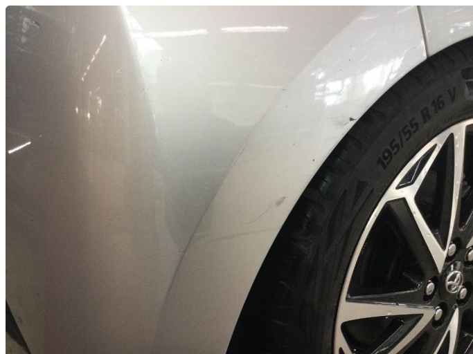
1.2 Liten bulk og små lakkskader