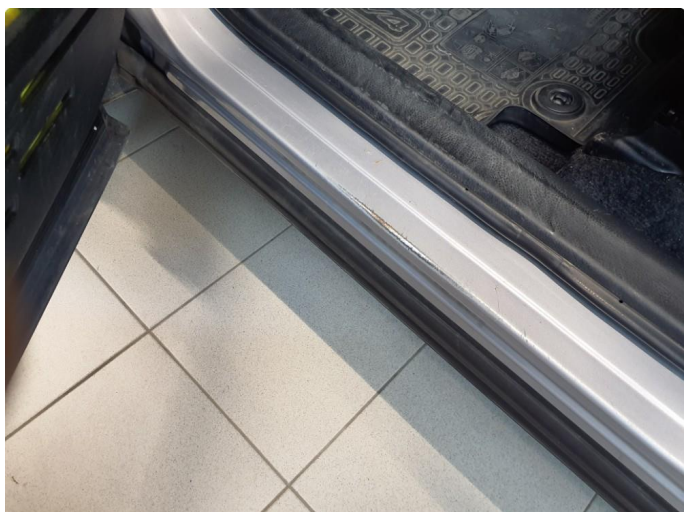
1.1 Litt slitt v/innstag