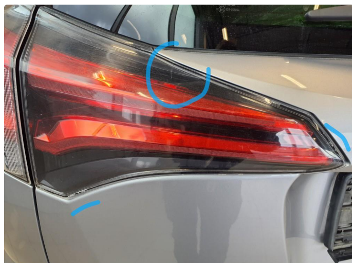
2.1 Noen småsprekker