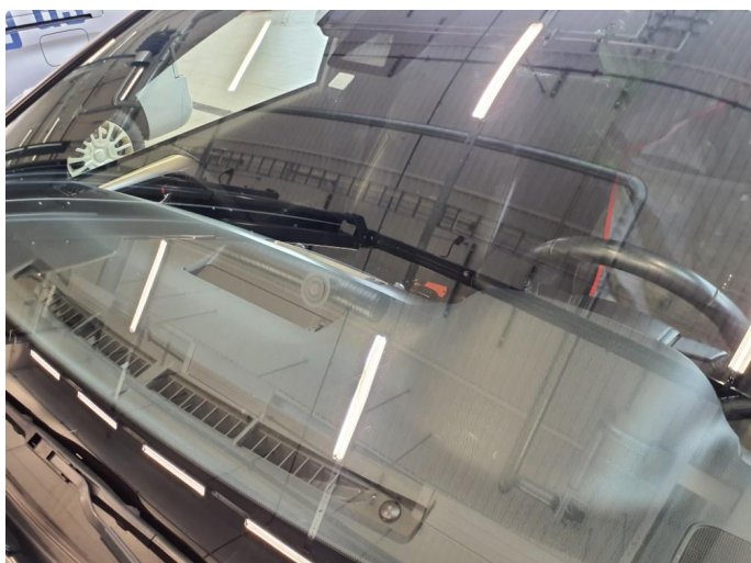
1.2 Noe steinsprut frontrute