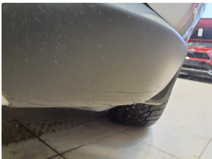
1.4 Skrubbskader underkant