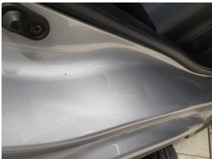
1.2 Noen riper og småbulker