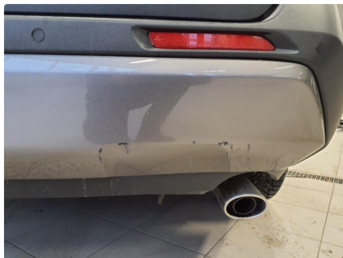
1.3 Noen riper nedre del