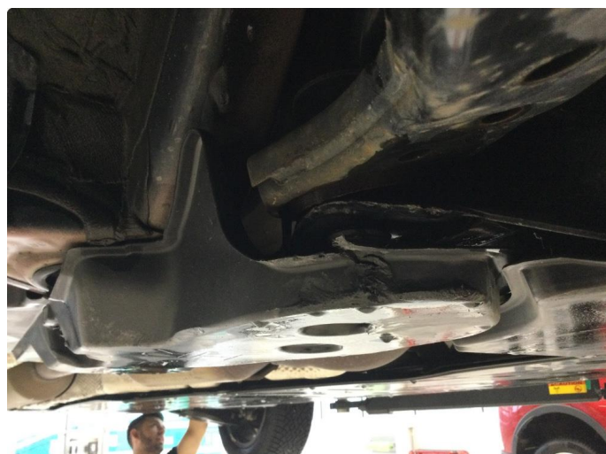
2.1 Liten bulk travers/aggregat holder