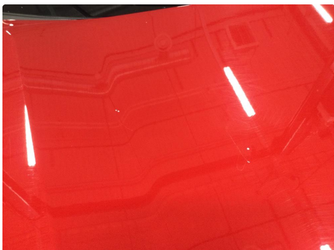
1.1 Noe steinsprut panser