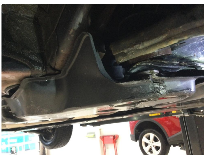
2.1 Liten bulk travers/aggregat holder