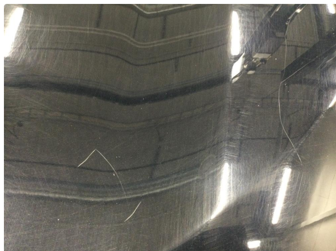
1.1 Noe steinsprut