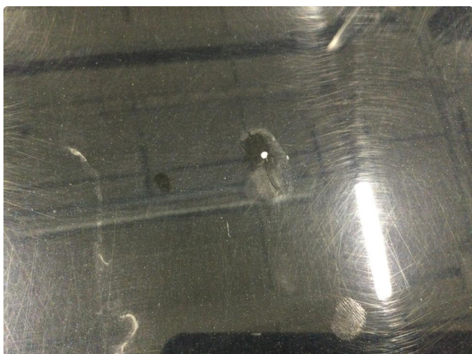
1.1 Noe steinsprut