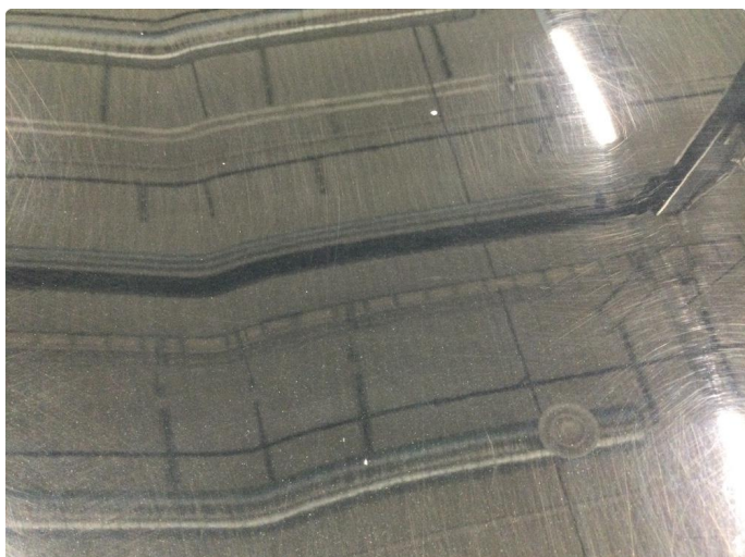
1.1 Noe steinsprut