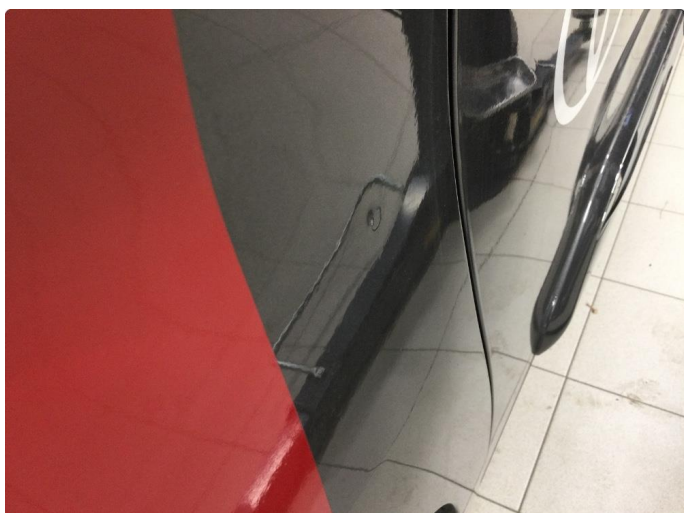
1.2 Liten bulk