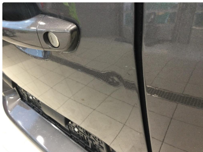
1.1 Liten bulk