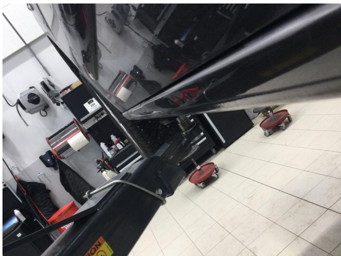
1.5 Liten bulk