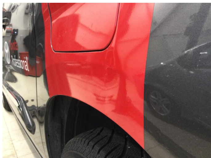
1.3 Liten bulk