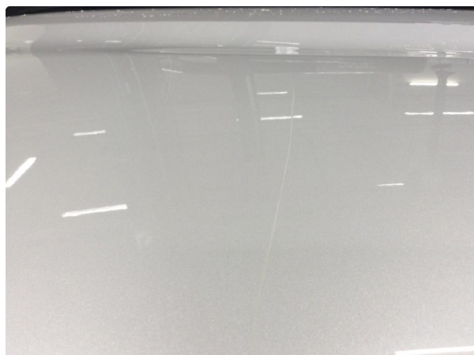
1.2 Noe riper