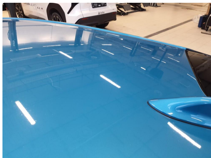
1.2 Noen riper