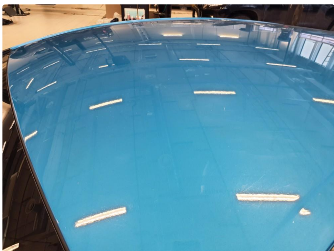
1.2 Noen riper