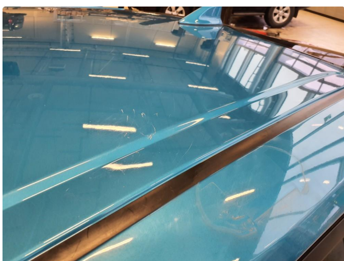
1.2 Noen riper