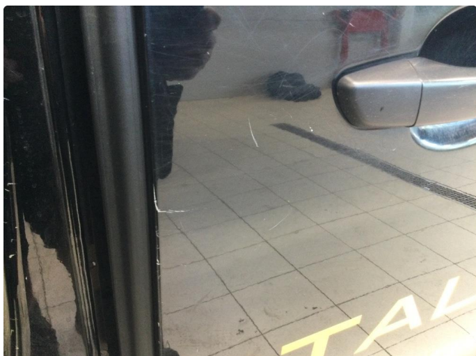
1.1 Liten bulk