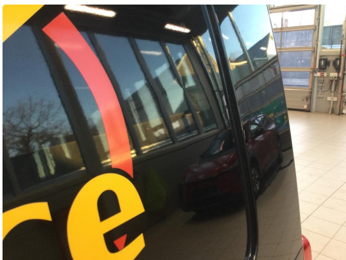
1.2 Liten bulk