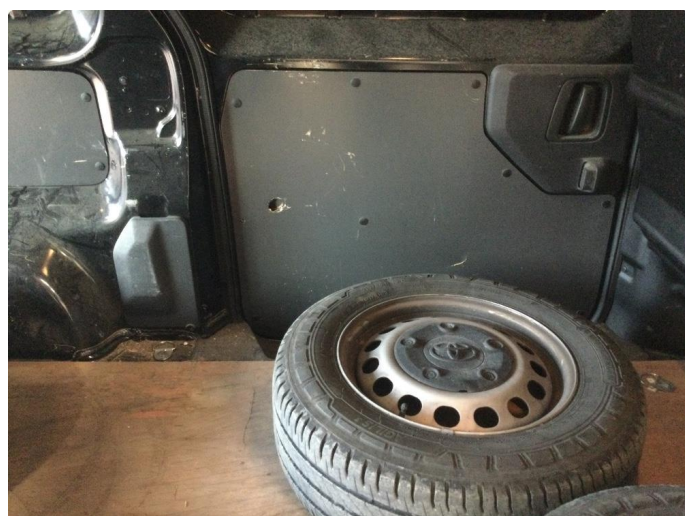
2.1 Noe slitasje/merker innvendig i varerom, samt "hjemmelaget" gulvplate