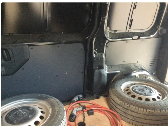
2.1 Noe slitasje/merker innvendig i varerom, samt "hjemmelaget" gulvplate