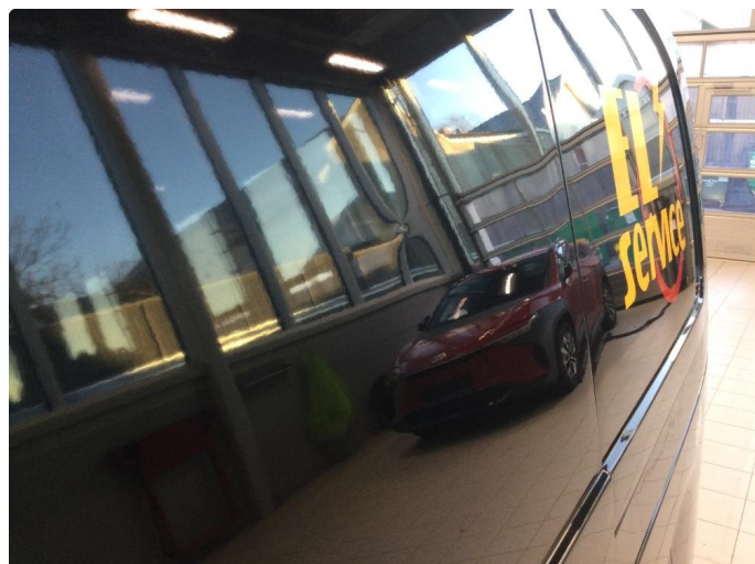
1.1 Liten bulk