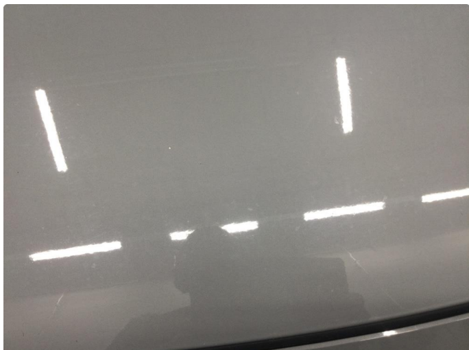
1.1 Noe steinsprut