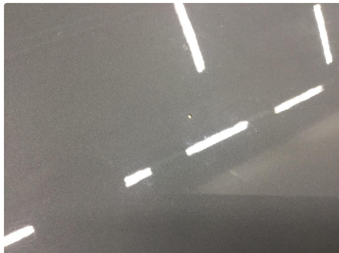
1.1 Noe steinsprut