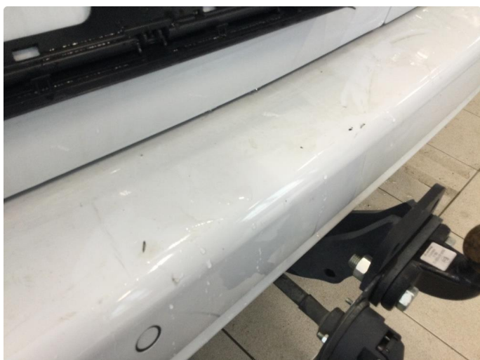
1.3 Små lakkskader