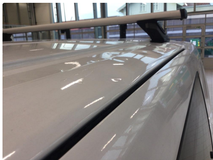
1.4 Liten bukk tak