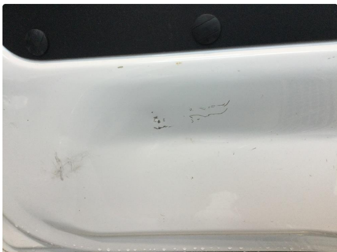
1.1 Småriper innvendig dør