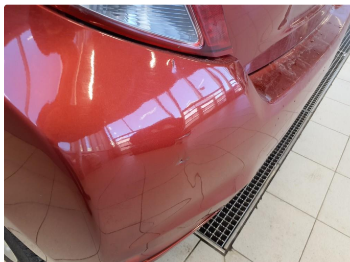
1.1 Generelt noe riper, småbulker og bruksmerker