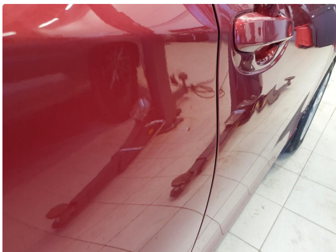
1.1 Generelt noe riper, småbulker og bruksmerker