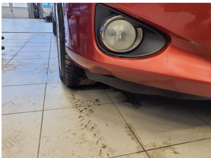
1.1 Generelt noe riper, småbulker og bruksmerker