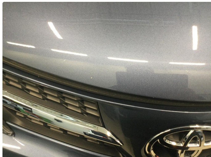
1.1 Noe steinsprut panser