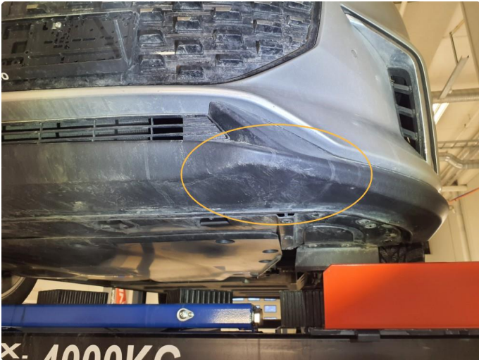
1.1 Små riper på den sorte plasten