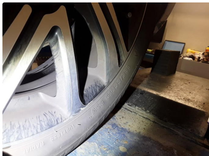
1.1 Merker kosmetisk