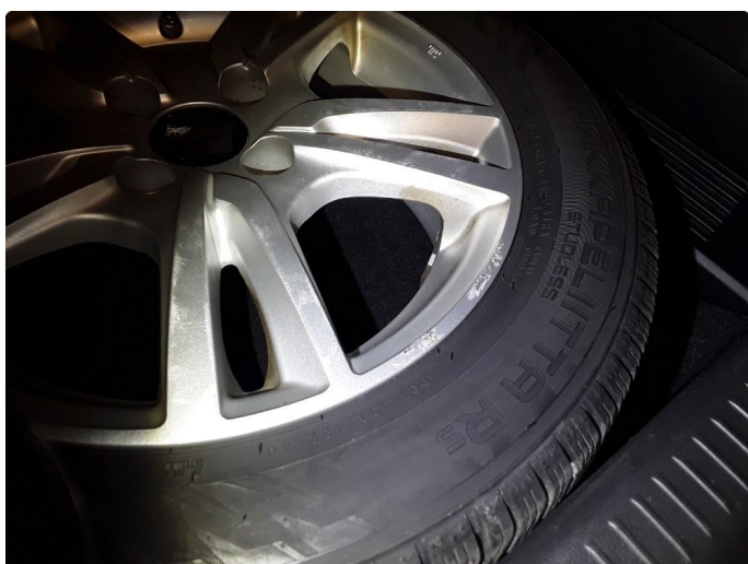
1.2 Merker kosmetisk