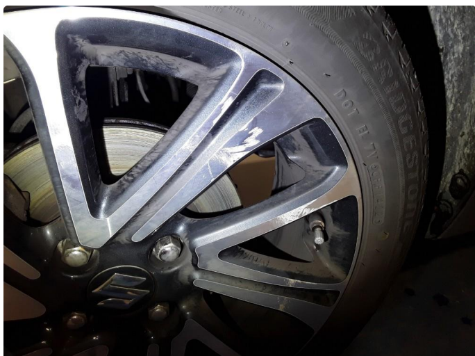
1.1 Merker kosmetisk