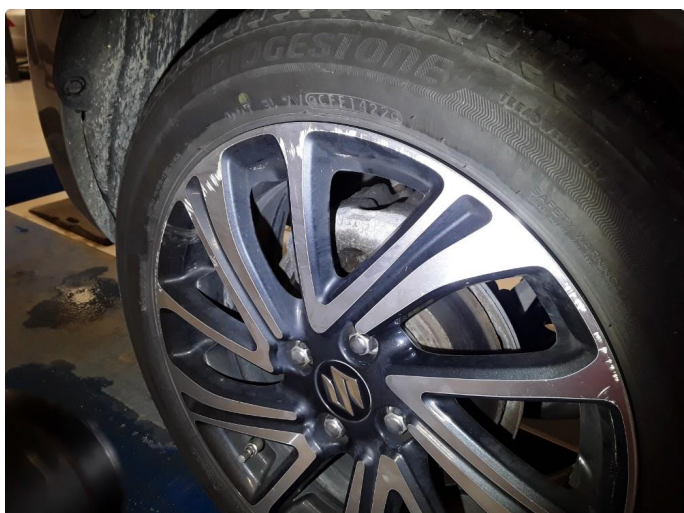
1.1 Merker kosmetisk