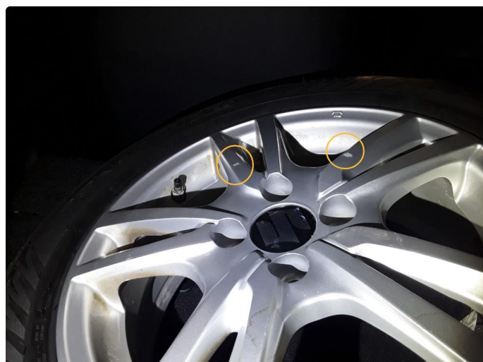
1.2 Merker kosmetisk