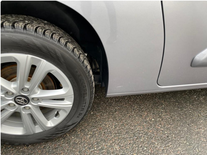
1.1 Kosmetisk merke er penslet