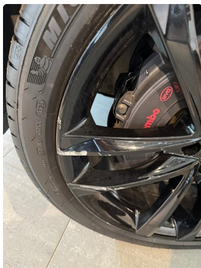
1.2 Merker felger