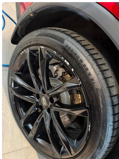
1.2 Merker felger