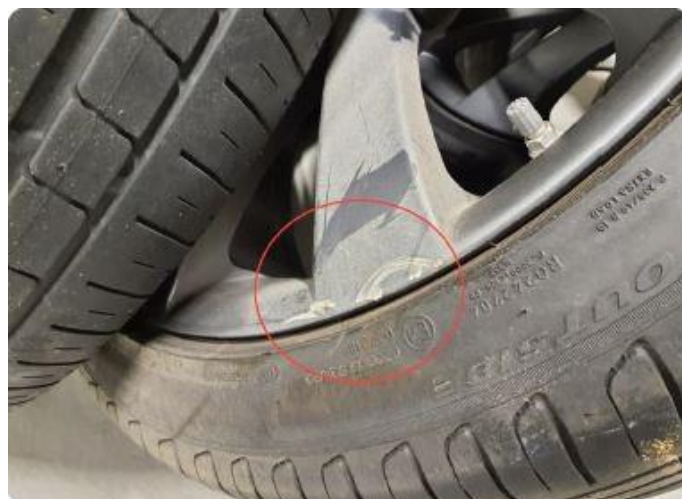
1.4 Merker felg