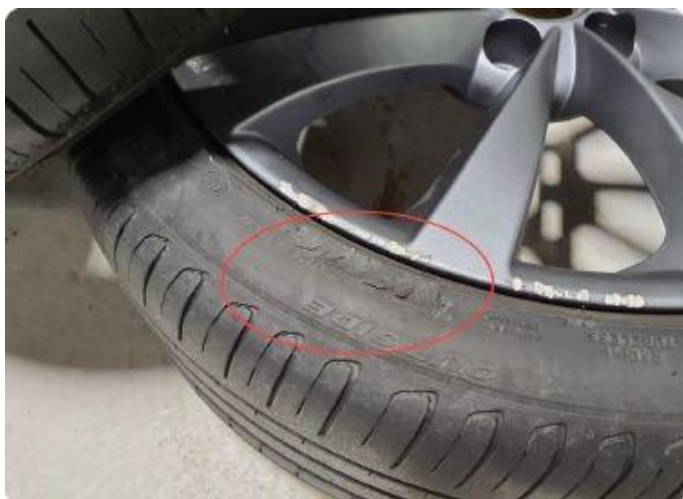
1.3 Merker sommerfelg.