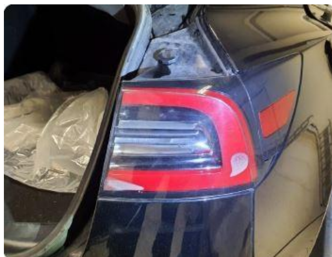
1.2 Fukt lampe