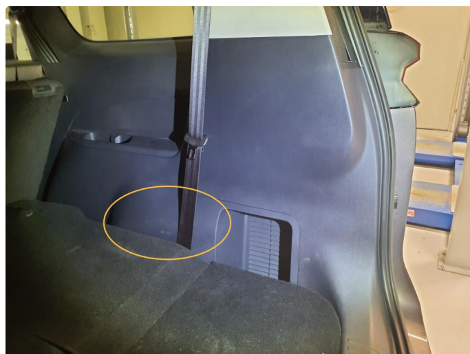
2.1 Svak ripe innvendig plast bagasjerom h side