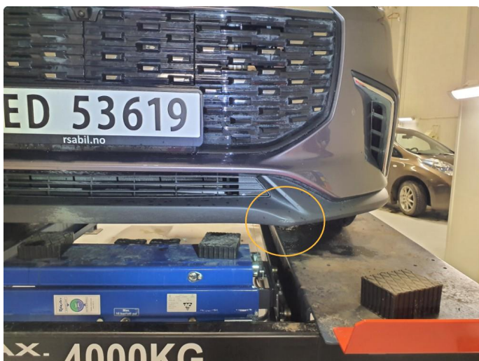
1.2 Skrubbskade i plast fanger front