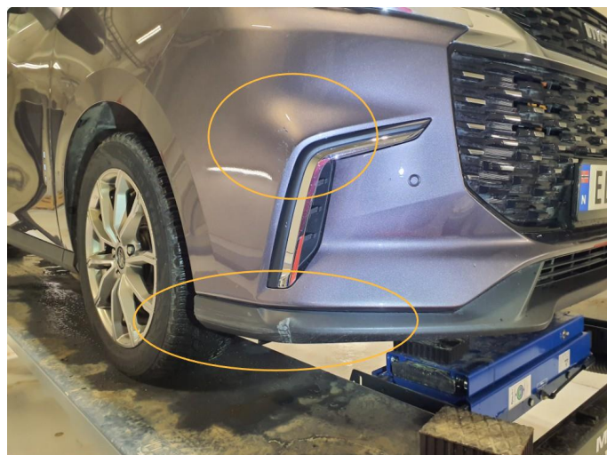
1.2 Skrubbskade i plast fanger front