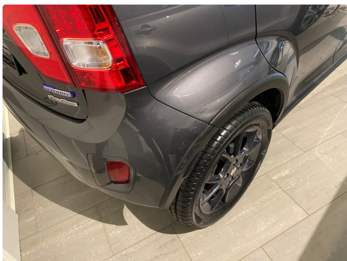
1.3 Kosmetiske merker(er penslet med lakkstift)