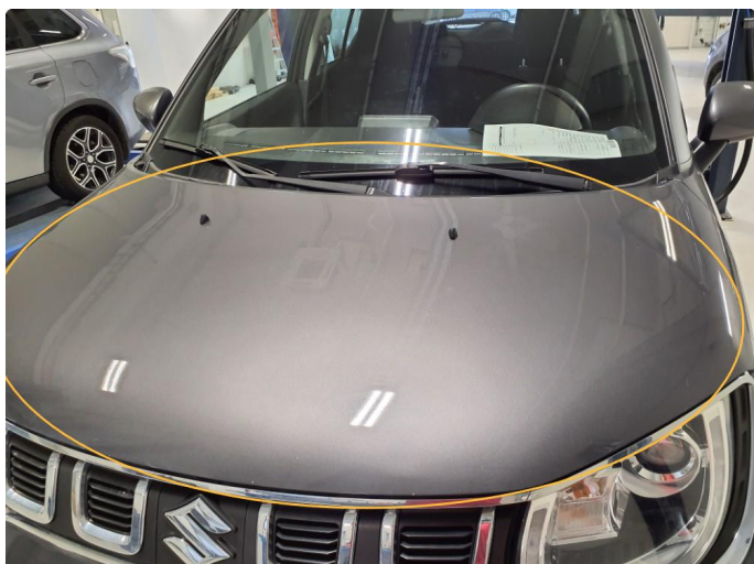
1.1 Kosmetisk, steinsprut er utbedret med lakkstift