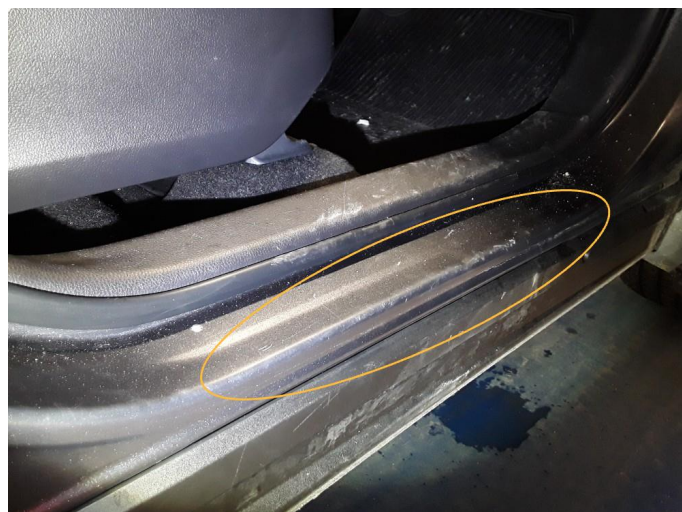
1.2 Merker, kosmetisk