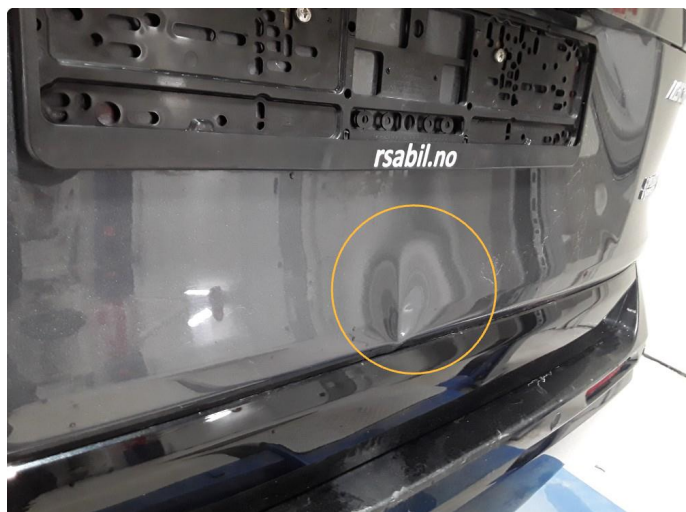
1.1 Bulk, vil bli utbedret