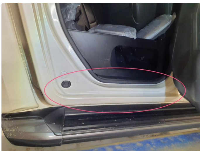
1.2 Merker i inn steg dører