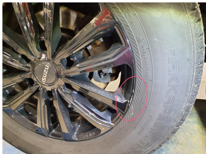
1.1 Merker i felger