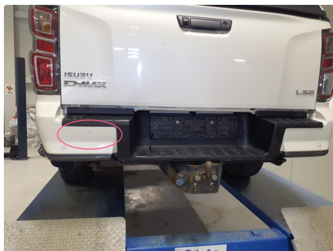
1.3 Merke i fanger flekket