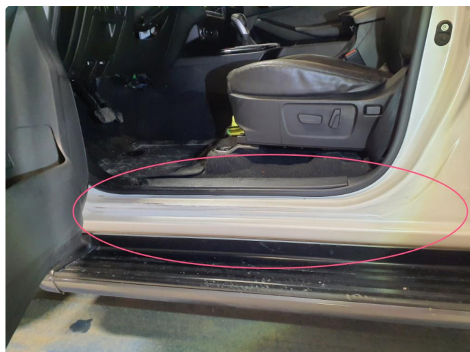
1.2 Merker i inn steg dører