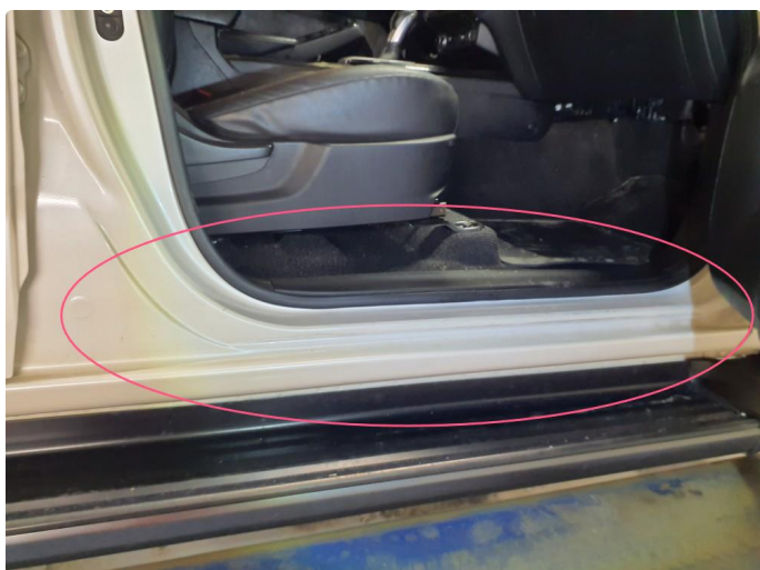
1.2 Merker i inn steg dører