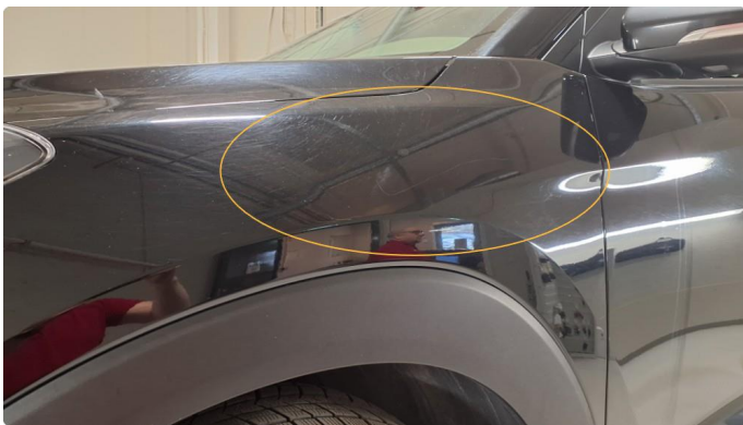
1.3 Lite merke