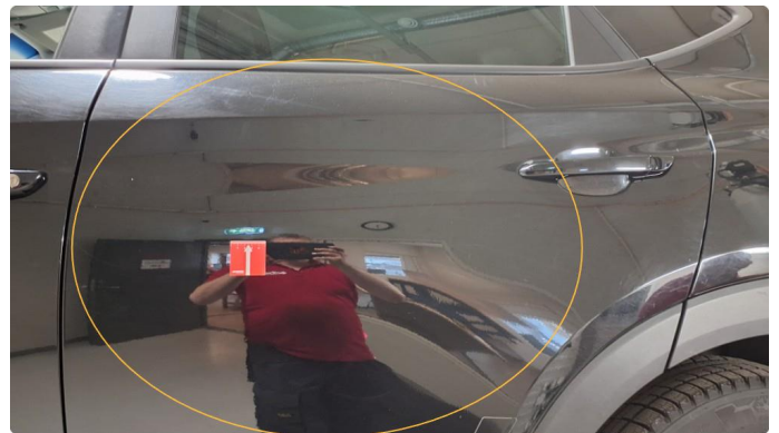
1.2 Lite merke