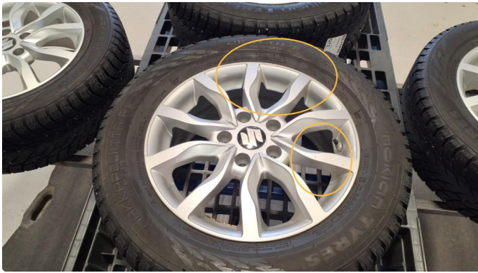
1.1 Kosmetiske merker felg(er)