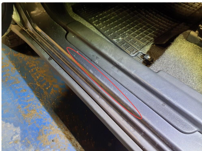
1.1 Merker (kosmetisk)