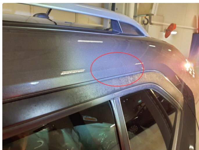
1.4 Merke kosmetisk (poleres)