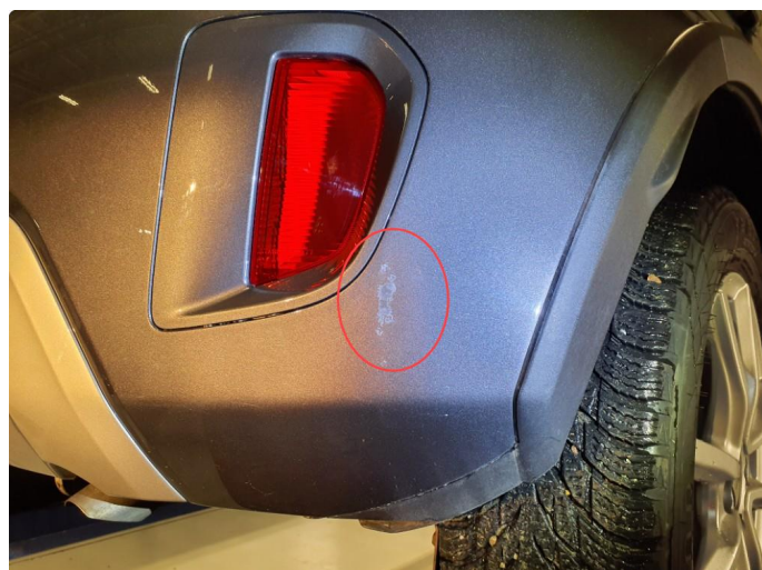
1.2 Merke Kosmetisk. Pensles med lakkstift