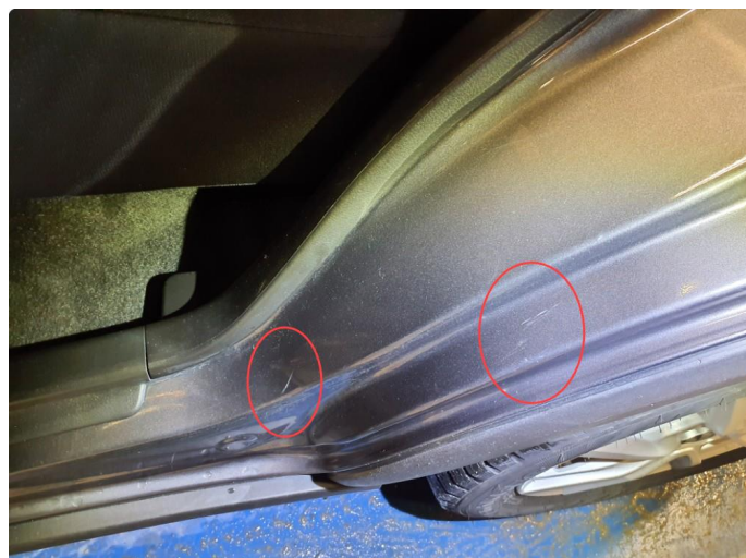
1.1 Merker (kosmetisk)