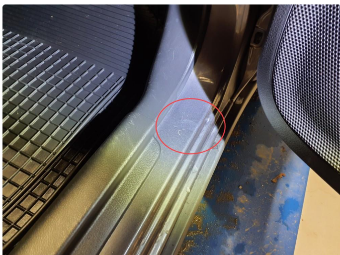
1.1 Merker (kosmetisk)