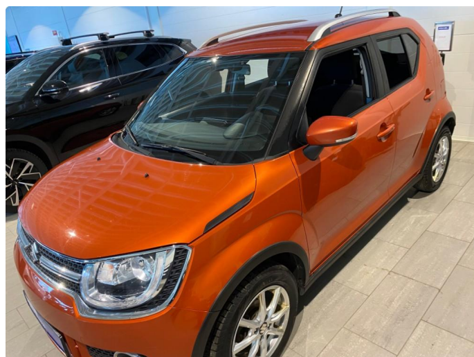
1.1 Steinsprut, merke fanger foran/bak