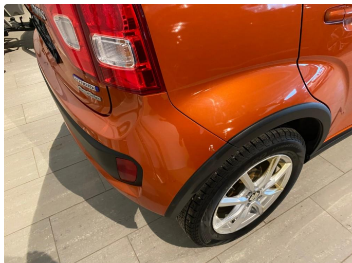
1.1 Steinsprut, merke fanger foran/bak