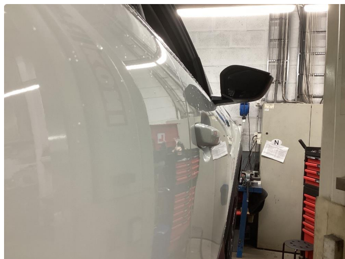
1.2 Lite synlig bulk uten lakkskade