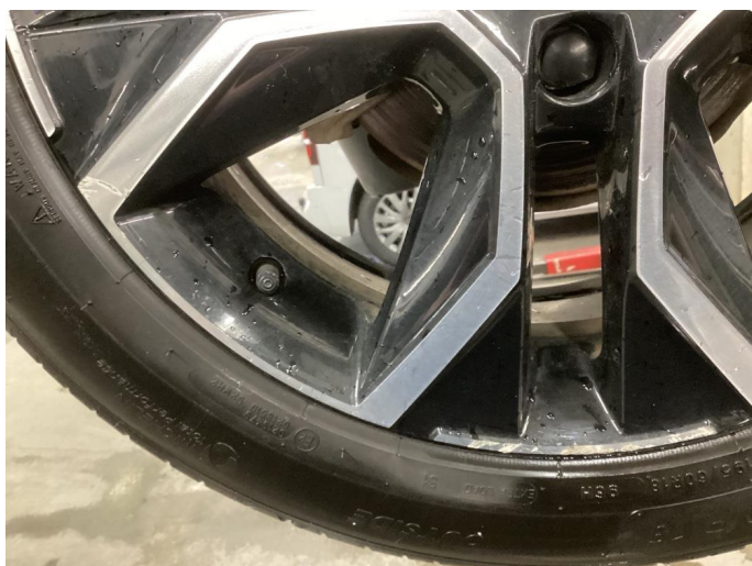
1.3 Kantkjørt felg Diamond Cut