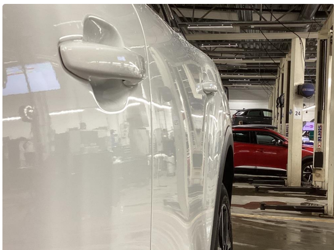
1.1 Lite synlig bulk uten lakkskade