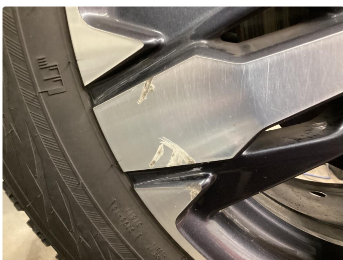
1.3 Kantkjørt felg Diamond Cut