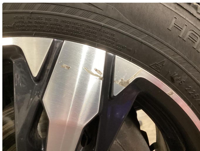
1.3 Kantkjørt felg Diamond Cut