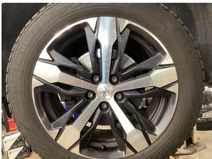
1.2 Oksidering på en vinterfelg