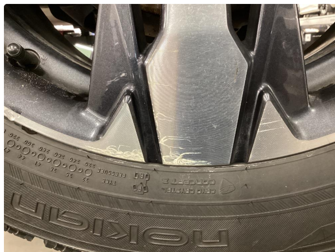
1.2 Oksidering på en vinterfelg