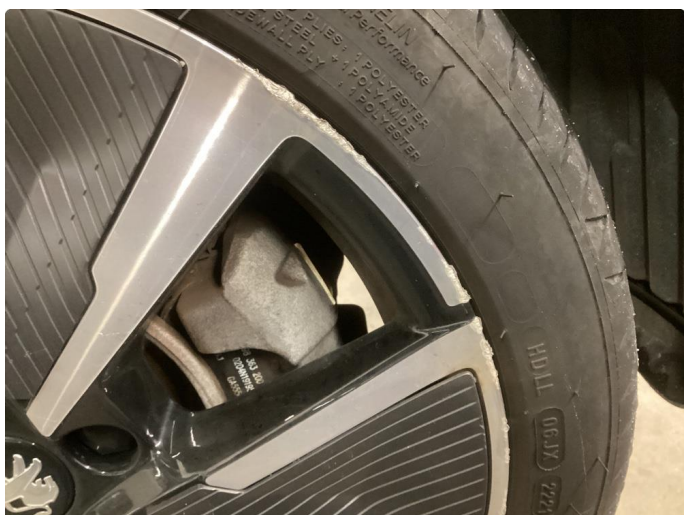
1.2 Noe kantkjørt felg