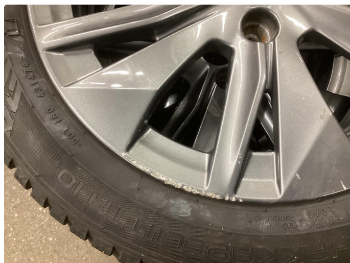
1.3 Noe kantkjørt felg