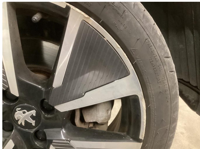
1.2 Noe kantkjørt felg