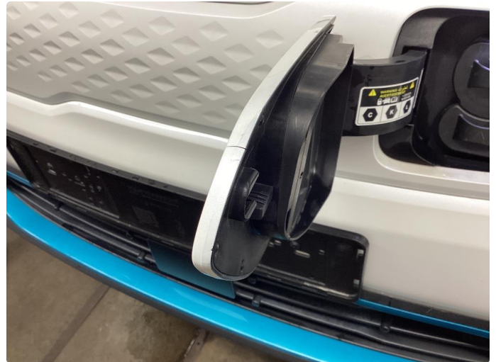
1.2 Liten sprekk i ladeluke