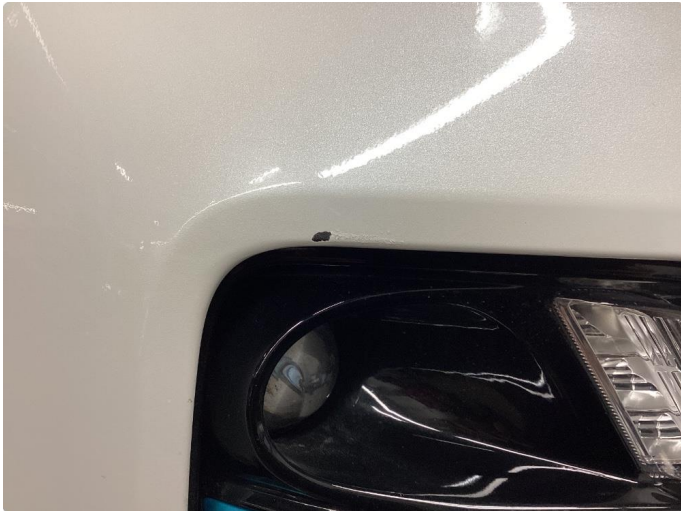
1.1 Liten ripe som skal flekkes