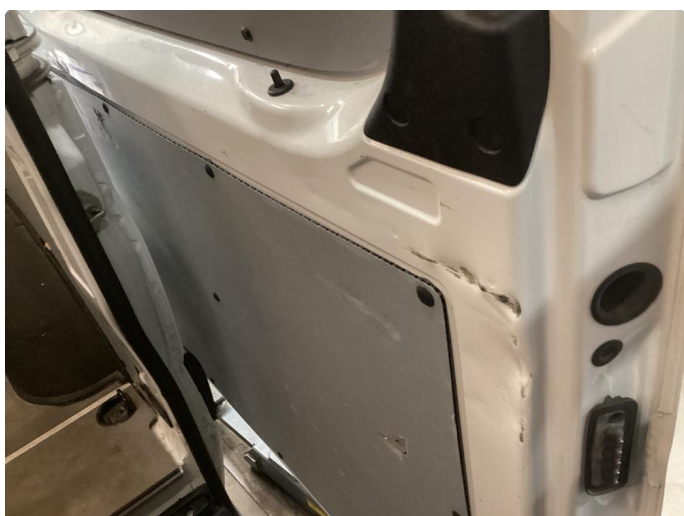
1.4 Bulk med lakkskade