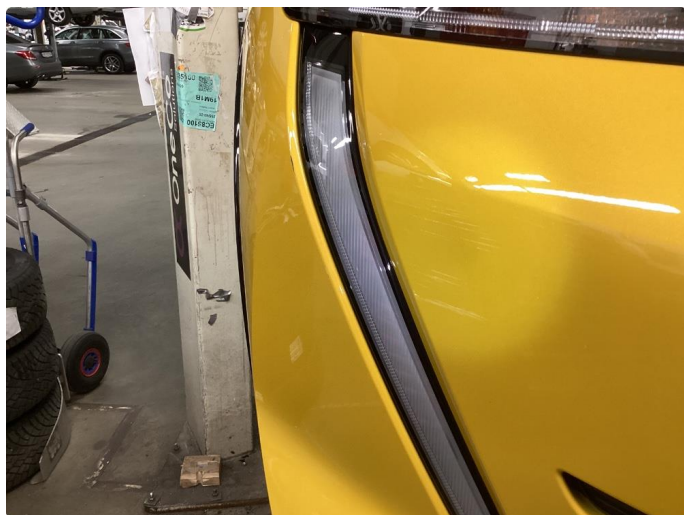
1.5 Riper, polert etter bildet.