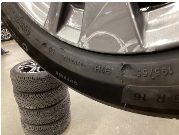
1.4 Dekkskade sommerhjul