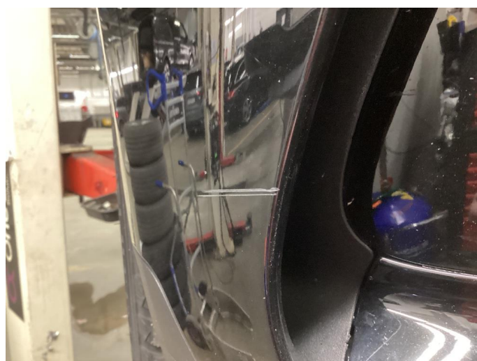
1.6 Lite synlig ripe som er utbedret/polert