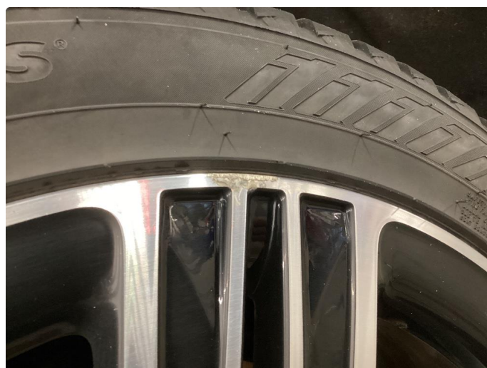
1.4 Kantkjørt felg Diamond Cut