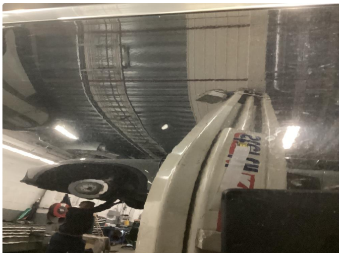
1.1 Liten bulk med litt lakkskade