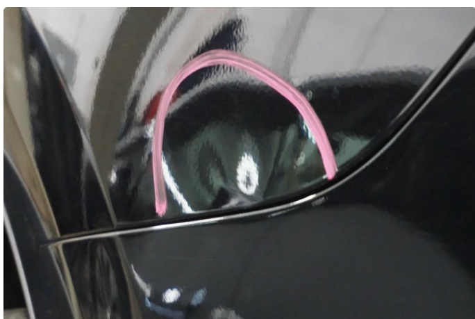
1.2 Liten bulk uten lakkskade