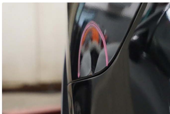
1.2 Liten bulk uten lakkskade