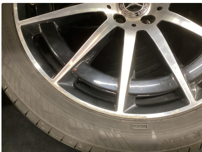
1.3 Kantkjørt felg Diamond Cut