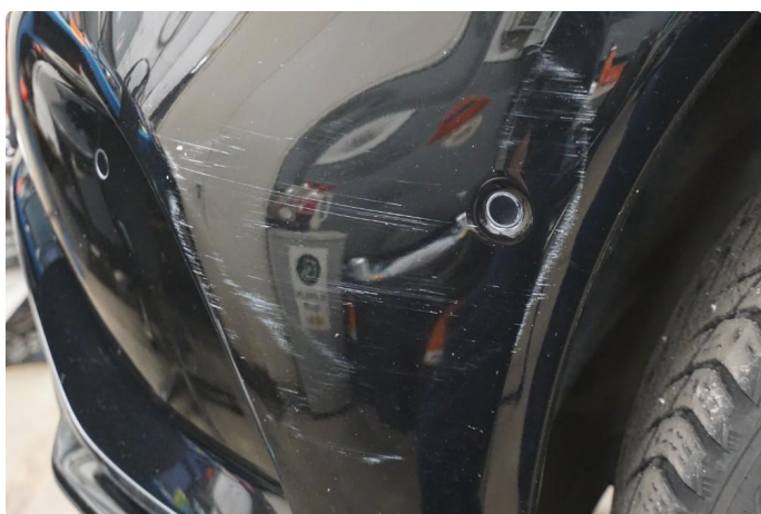
1.5 Lite synlige riper som er polert