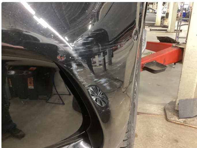
1.5 Lite synlige riper som er polert