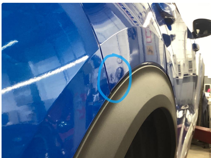
1.3 Liten bulk uten lakkskade