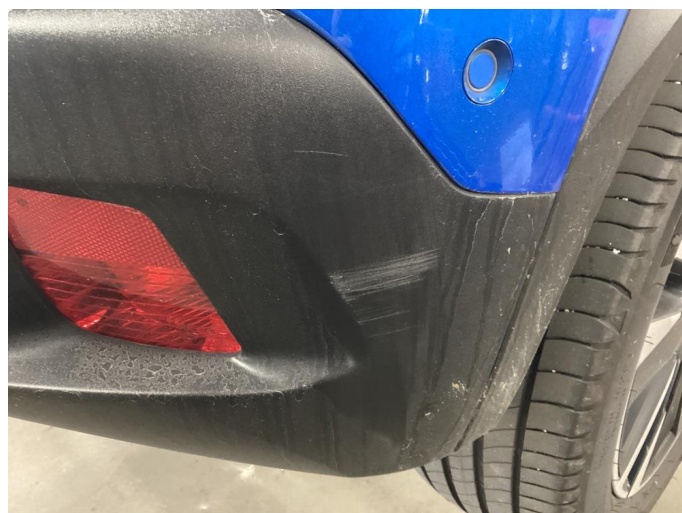
1.4 Litt riper i plast på støtfanger