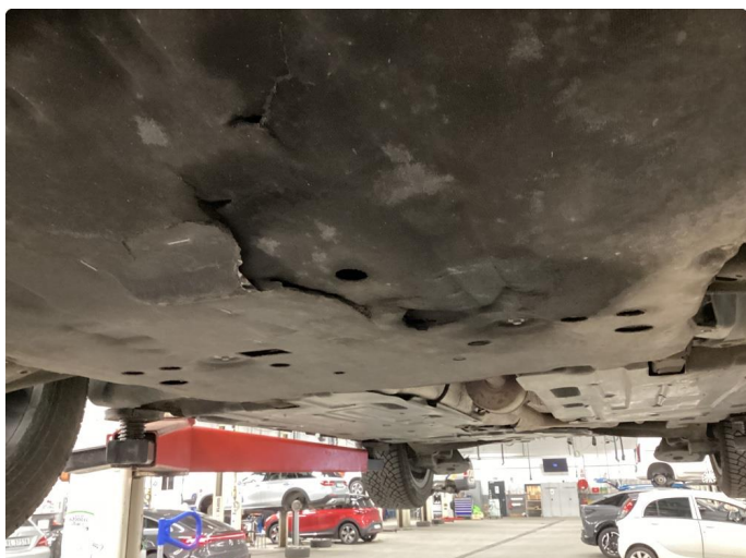
1.1 Beskyttelsesplate skadet/mangler