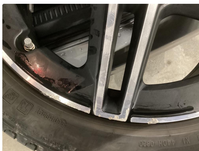
1.4 Kantkjørt felg