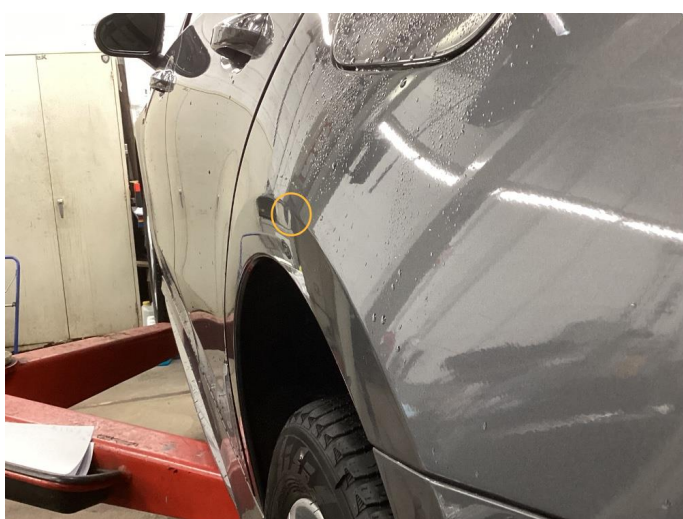
1.3 Liten bulk