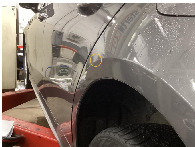
1.3 Liten bulk