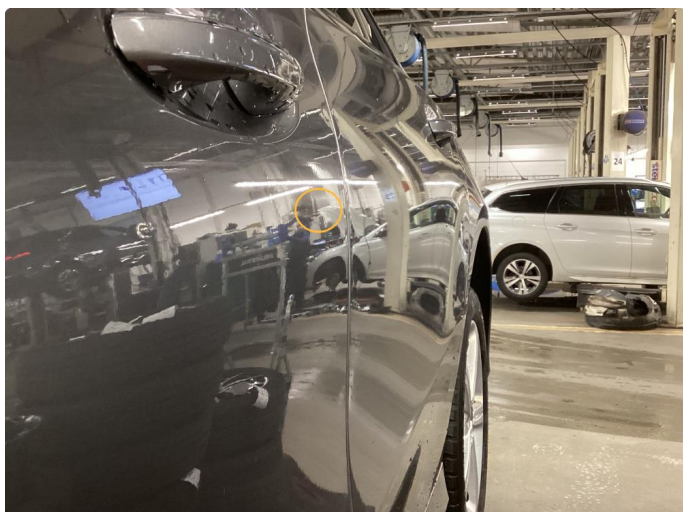
1.1 Liten bulk