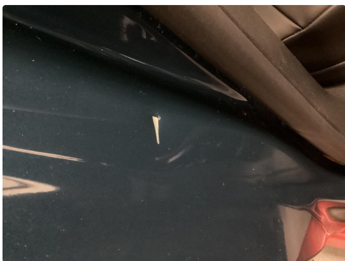
1.3 Liten bulk med lakkskade inni døråpning høyre bak