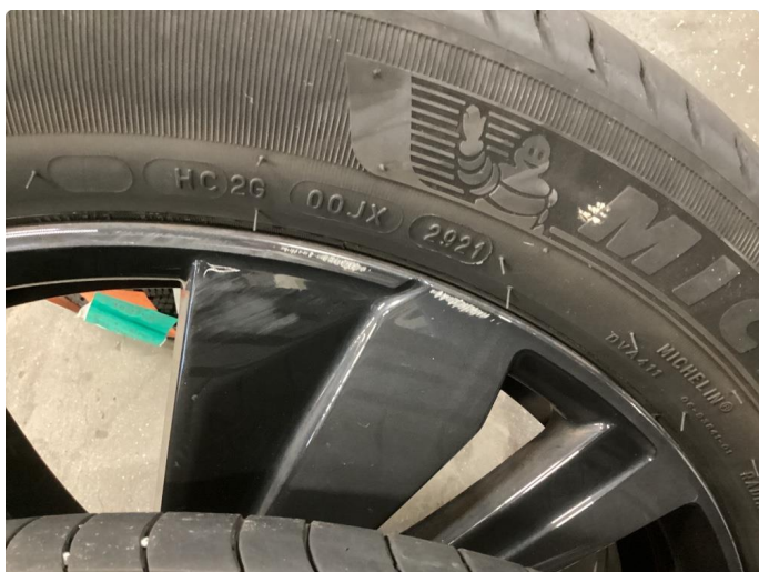
1.2 Liten kantskade sommerfelg