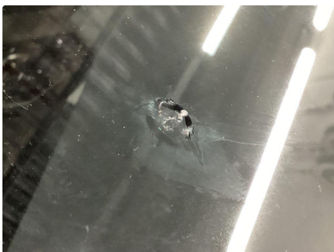
1.5 Steinsprut med sprekk utenfor synsfelt som er limt