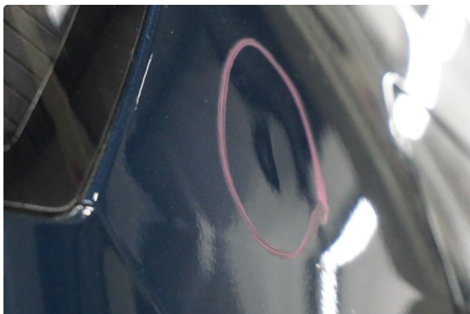
1.1 Liten bulk uten lakkskade