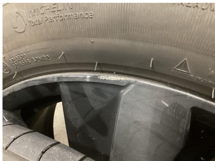
1.2 Liten kantskade sommerfelg