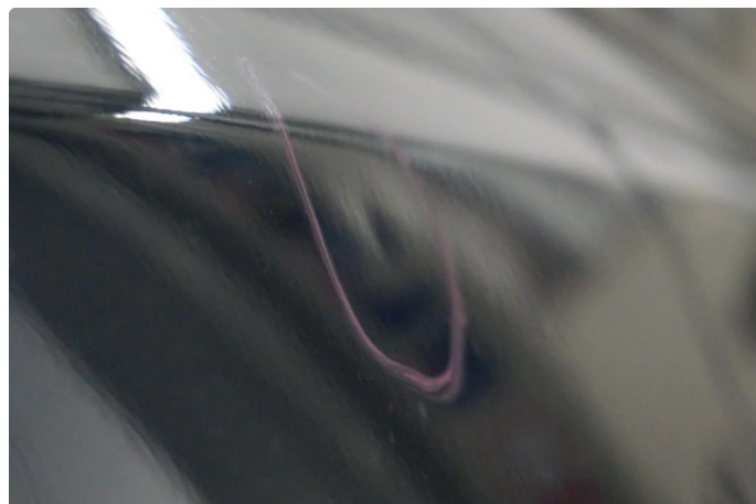
1.1 Liten bulk uten lakkskade