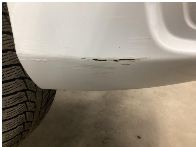
1.7 Ripe(r) ned til grunning