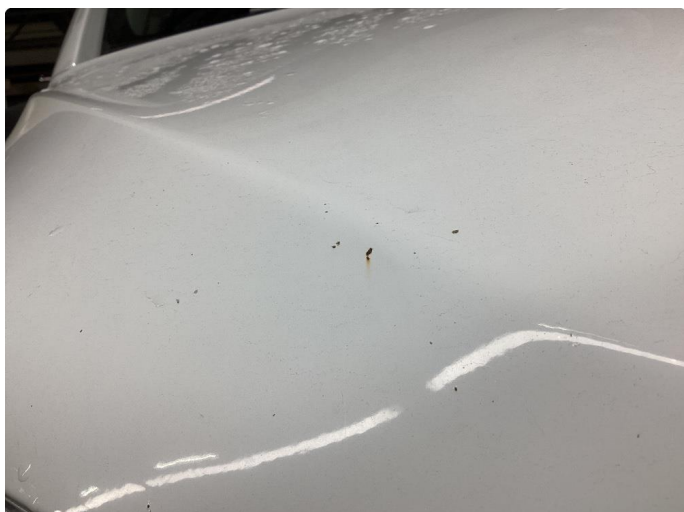
1.1 Noe steinsprut med rust