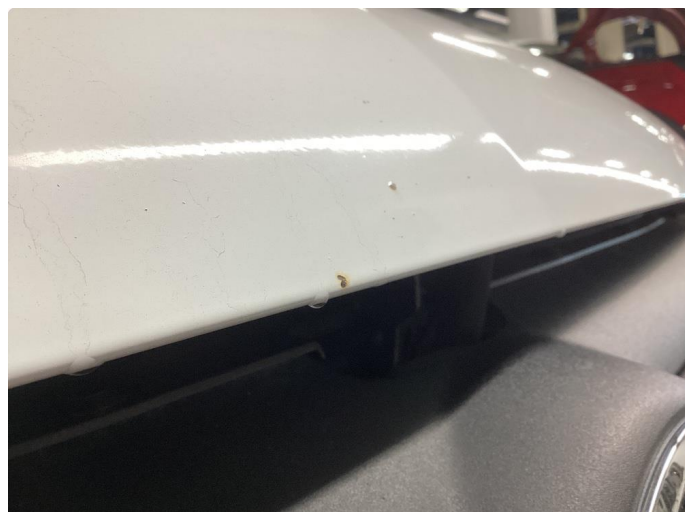
1.1 Noe steinsprut med rust