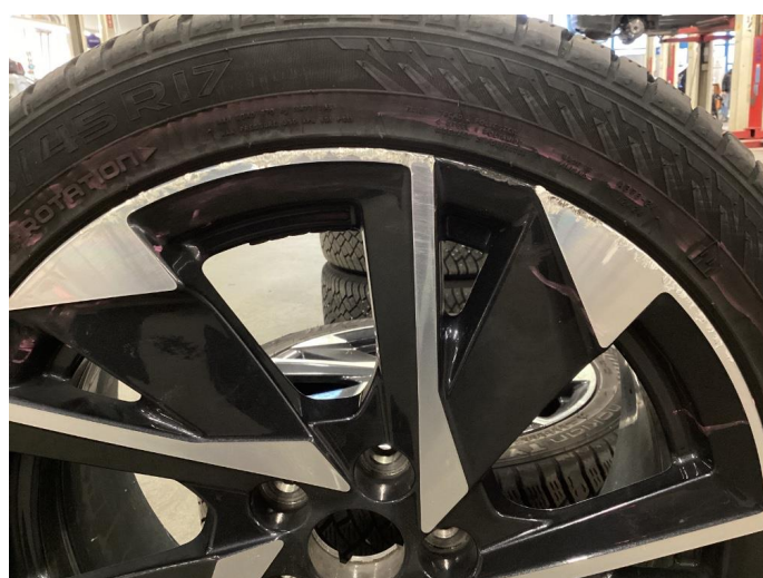
1.2 Kantkjørt felg Diamond Cut