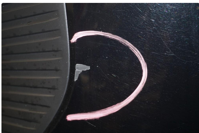
1.3 Lite synlige riper som er polert