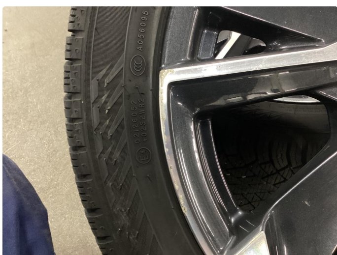
1.2 Kantkjørt felg Diamond Cut