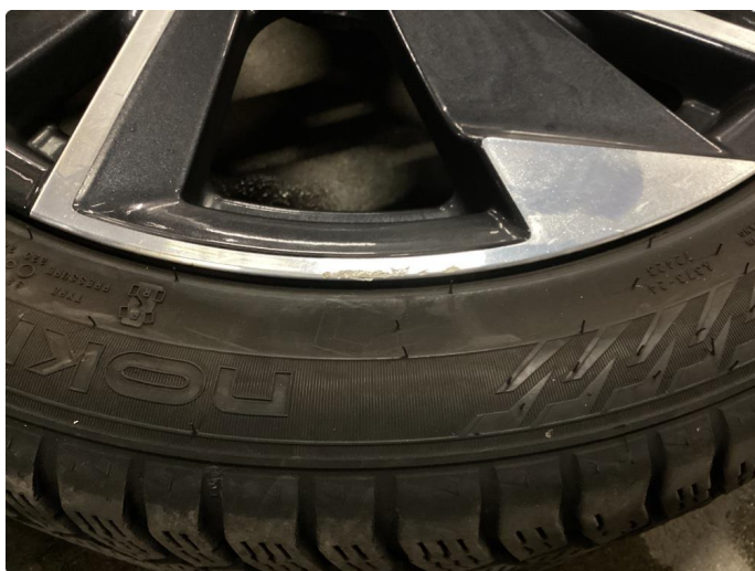
1.2 Kantkjørt felg Diamond Cut