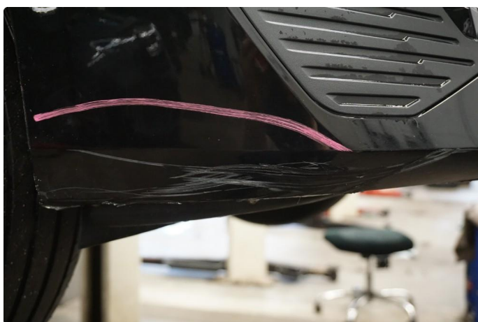
1.4 Riper i underkant av støtfanger