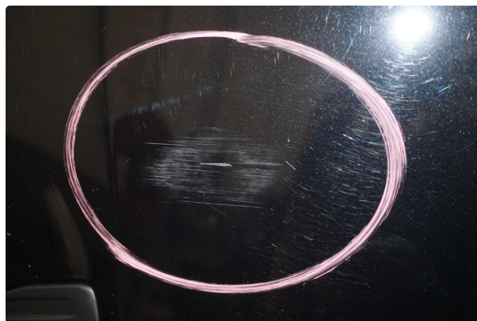
1.3 Lite synlige riper som er polert