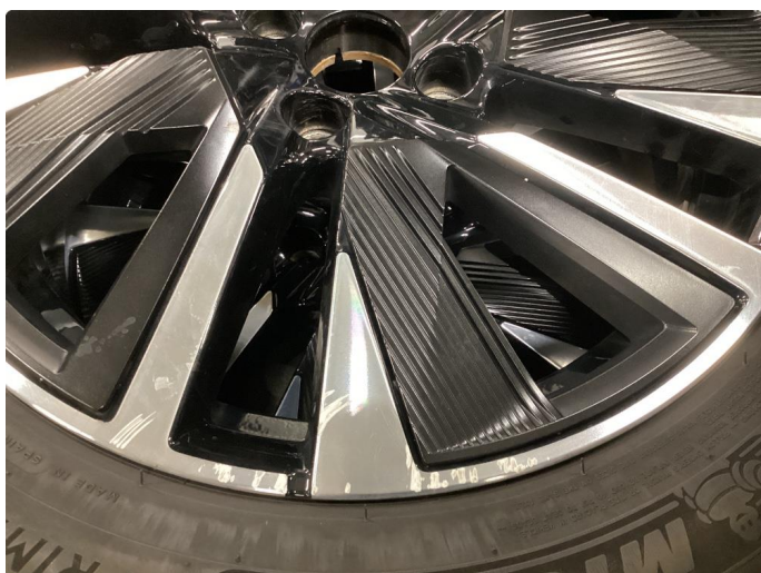
1.3 Kantkjørt felg Diamond Cut sommerhjul