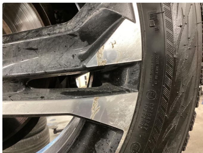
1.4 Kantkjørt felg Diamond Cut vinterhjul