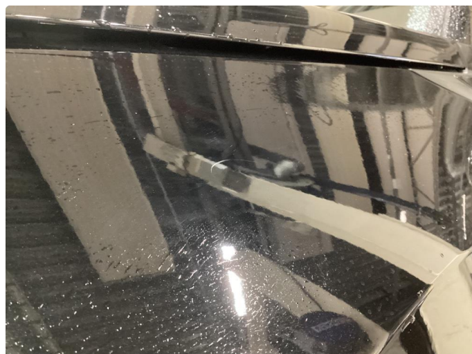
1.2 Lite synlig ripe