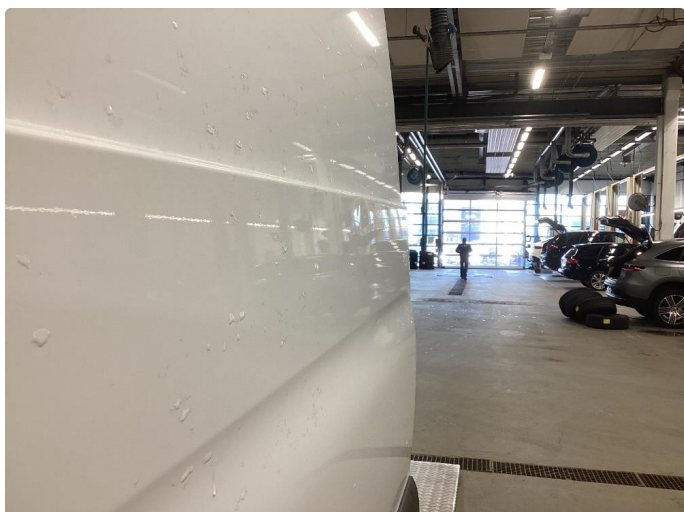
1.1 Bulk uten lakkskade