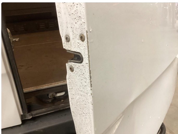
1.3 Ripe som er flekket