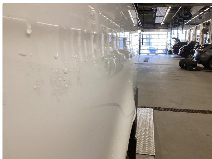
1.4 Bulk uten lakkskade