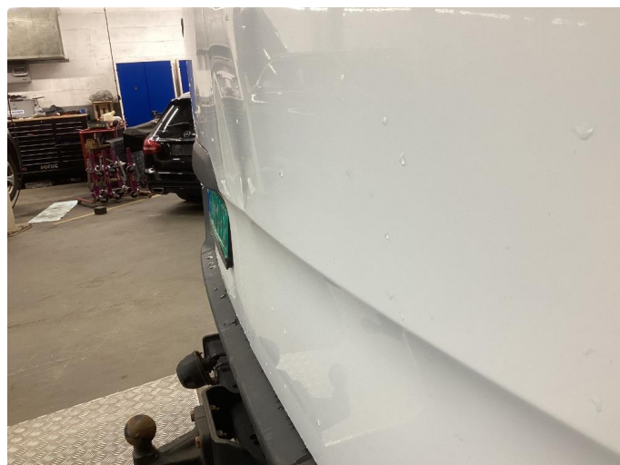
1.2 Bulk uten lakkskade