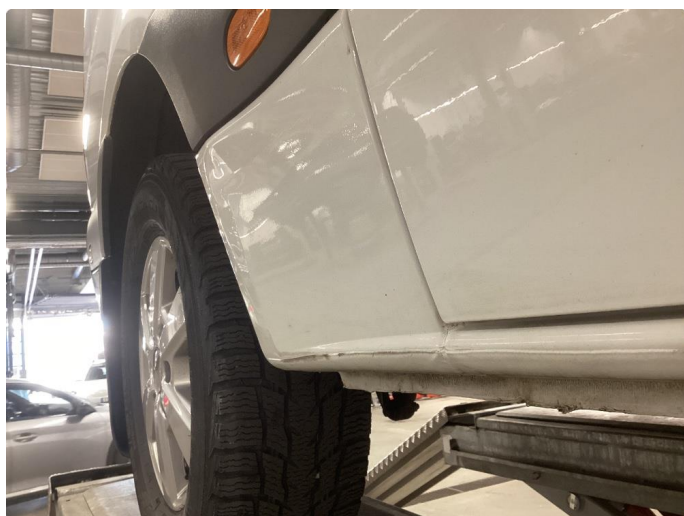
1.7 Bulk uten lakkskade