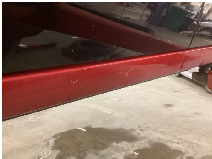
1.6 Bulk med lakkskade