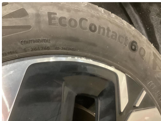
1.3 Kantkjørt felg Diamond Cut