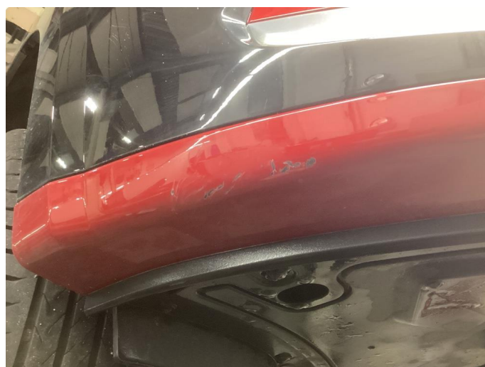
1.5 Skrubbskader underkant