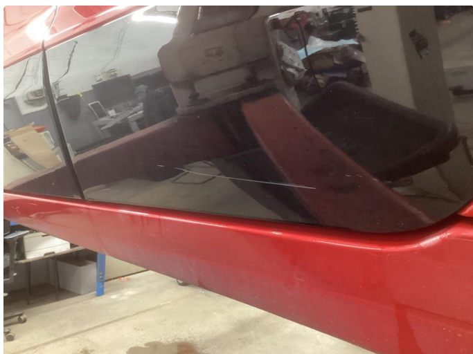
1.1 Ripe ned til grunning