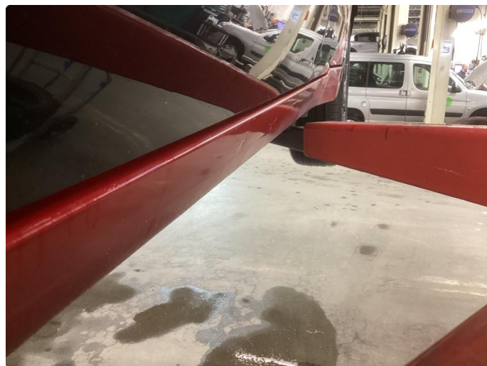
1.6 Bulk med lakkskade