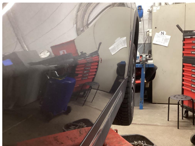
1.2 2 mindre bulker