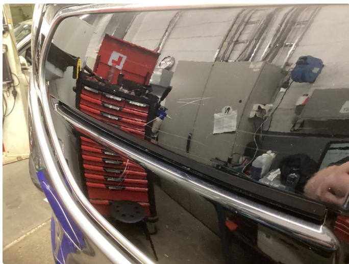
1.5 Lite synlig