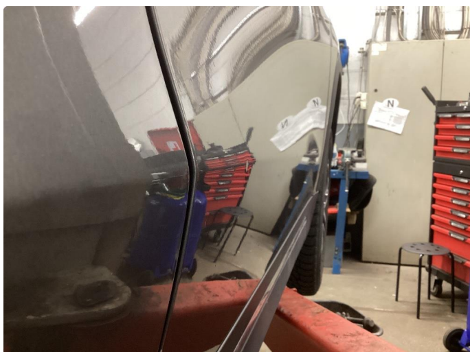
1.2 2 mindre bulker