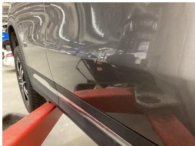
1.2 2 mindre bulker