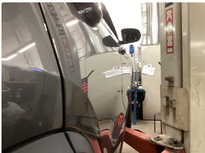
1.1 Liten bulk